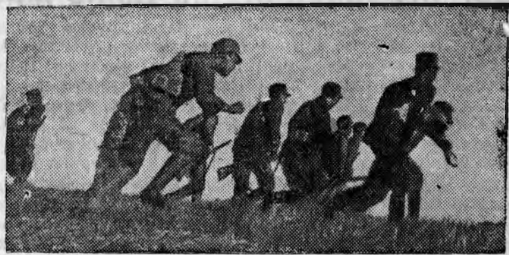
НА СНИМКЕ: Бойцы 8-й народно-революционной армии Китая идут в наступление.